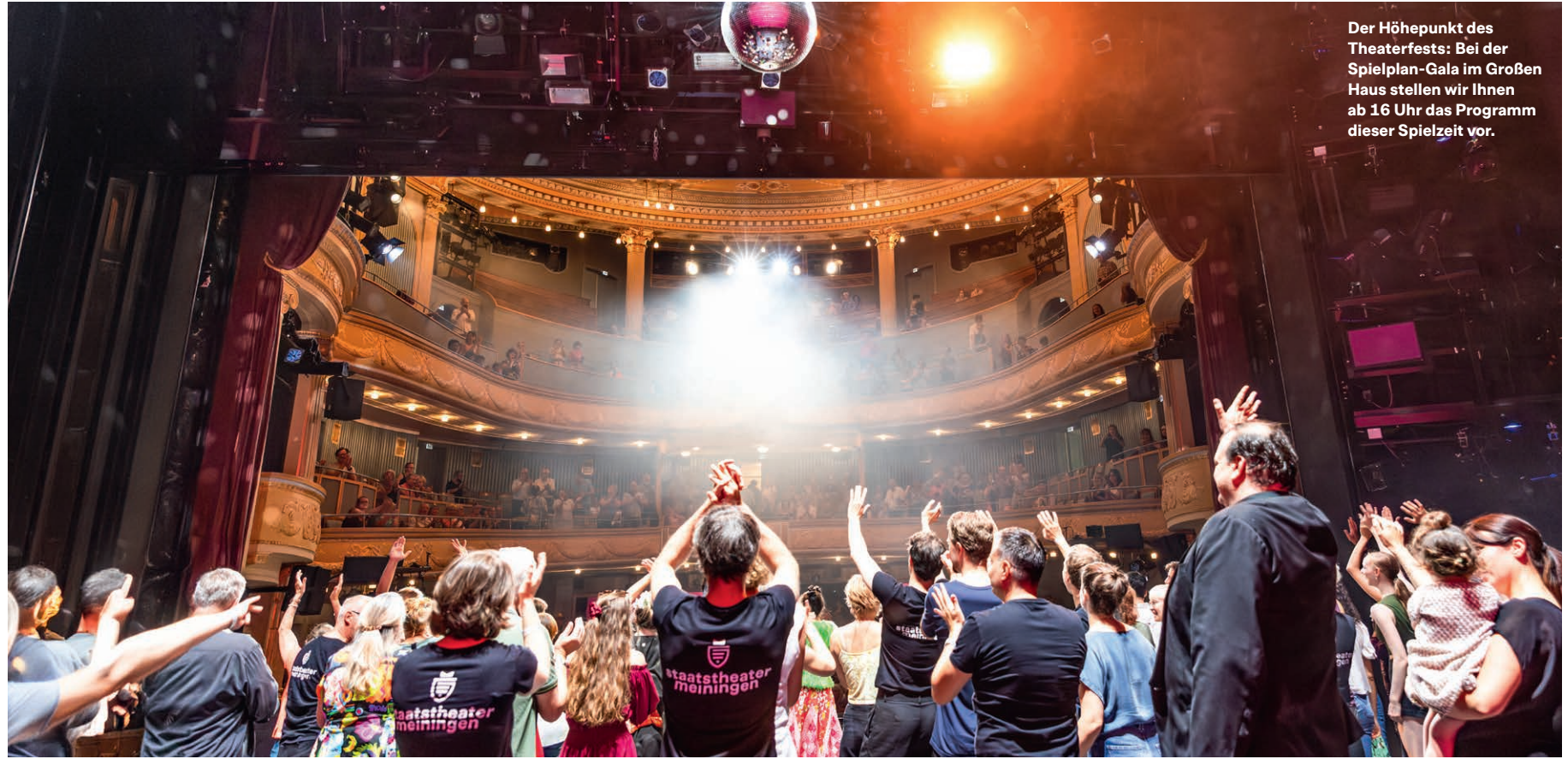
Der Höhepunkt des Theaterfestes: Bei der Spielplan-Gala im Großen Haus stellen wir Ihnen ab 16 Uhr das Programm dieser Spielzeit vor.