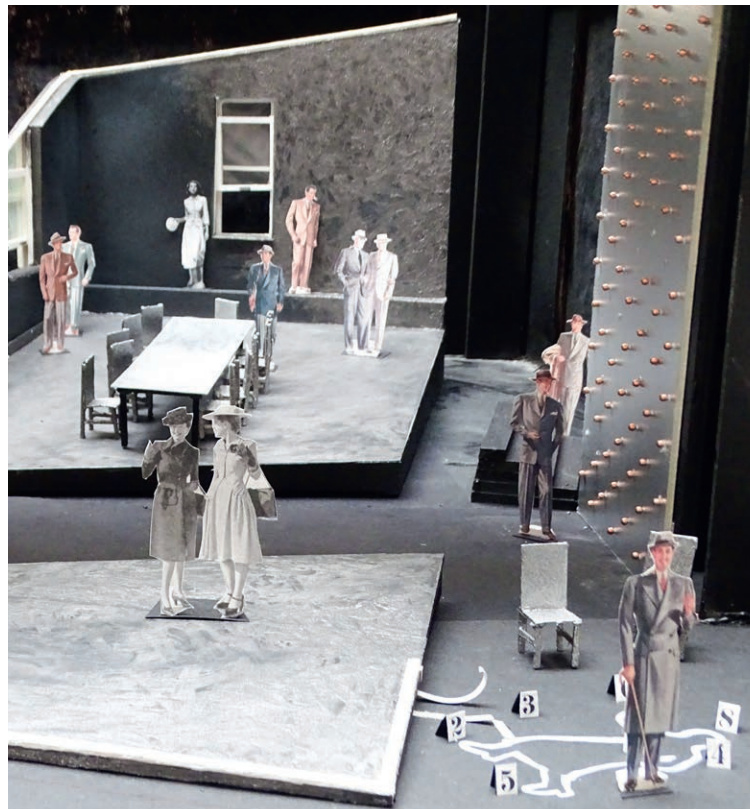
Zwölf Geschworene müssen über Schuld oder Unschuld entscheiden.

Darum geht es: Eine Jury von zwölf Geschworenen findet sich in einem Besprechungssaal wieder. Nach drei Tagen im Gericht muss die Verhandlung unterbrochen werden, weil einer von ihnen unter ungeklärten Umständen zusammenbricht. Lag es an den abscheulichen Dingen, die von den Zeugen berichtet wurden? Lag es an dem bestialischen Lachen und der Aussage „Ladies First“ des Angeklagten, nachdem er mutmaßlich seine Frau die Steilküste hinunterstieß? Oder lag es einfach an der glühenden Hitze dieser Tage?