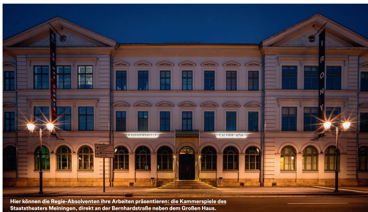
Hier können die Regie-Absolventen ihre Arbeiten präsentieren: die Kammerspiele des Staatstheaters Meiningen, direkt an der Bernhardstraße neben dem Großen Haus.

TERMIN: DO, 26.03.2026, 19.30 Uhr – Kammerspiele