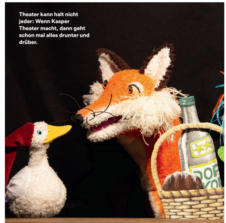
Theater kann halt nicht jeder: Wenn Kasper Theater macht, dann geht schon mal alles drunter und drüber.