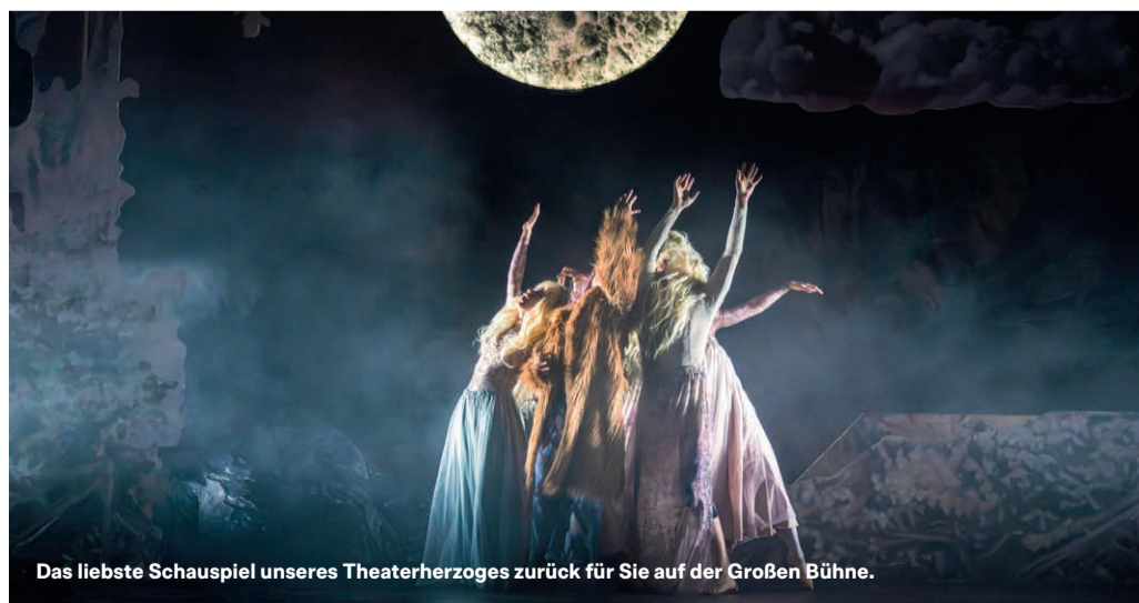
Das liebste Schauspielerspiel unseres Theaterherzogs zurück für Sie auf der Großen Bühne.

Ein Schauspielerspiel des spielfreudigen Ensembles