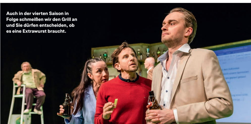
Auch in der vierten Saison in Folge schmeißen wir den Grill an und Sie dürfen entscheiden, ob es eine Extrawurst braucht.