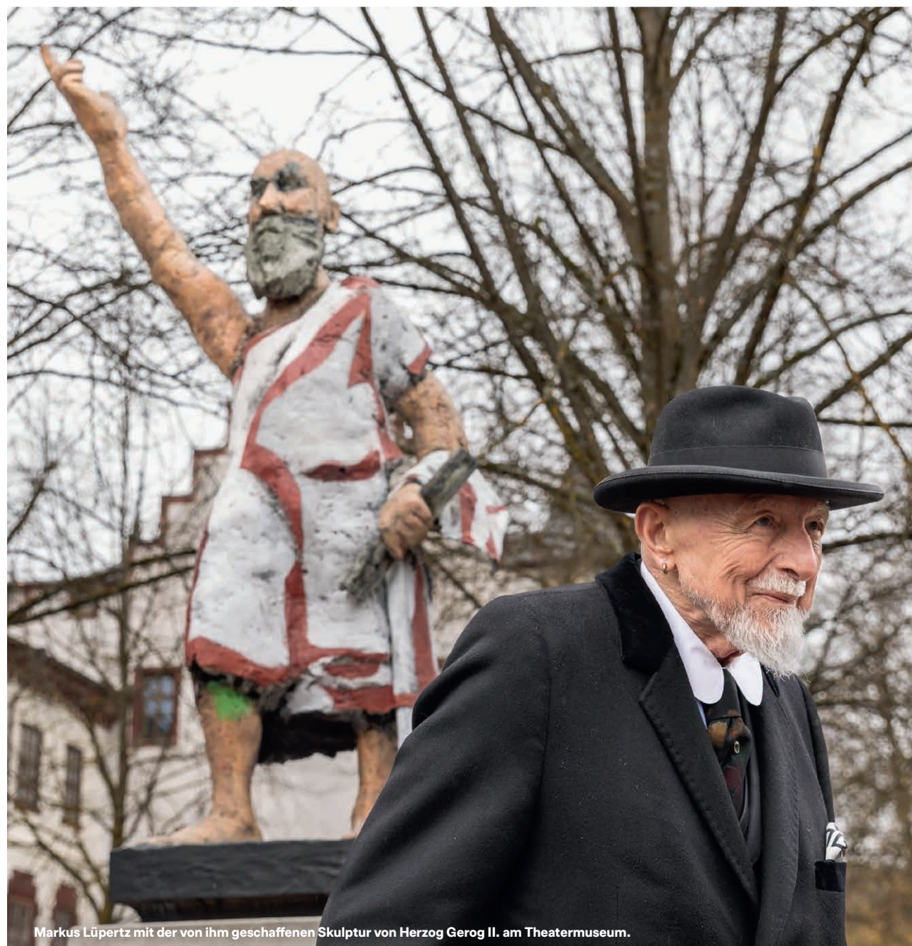
Markus Lüpertz mit der von ihm geschaffenen Skulptur von Herzog Georg II. am Theatermuseum.

GEORGIJAHR Mit „La Bohème“ nahm eine besondere Verbindung im Jahr 2021 ihren Anfang: Meiningen und Markus Lüpertz. Einer der bedeutendsten Maler und Bildhauer unserer Zeit macht Theater in der Theaterstadt. Nun hat der Regisseur, Bühnen- und Kostümbildner mit „Das Rheingold“ Ende März erneut in Meiningen Premiere gefeiert. Die Oper ist aber nicht das Einzige, das Markus Lüpertz in diesem Jubiläumsjahr mit Meiningen verbindet. Er hat eine Bronzeskulptur erschaffen, 2,20 Meter groß, die Herzog Georg II. zeigt und nun ihren Platz am Theatermuseum gefunden hat.