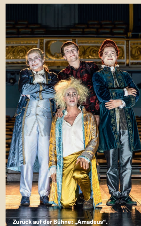
Zurück auf der Bühne: „Amadeus“

„Amadeus“ ist ein Krimi mit Tiefgang. Mit dem Kunstgriff, dass die letzten Lebensjahre Mozarts aus der Perspektive seines Gegenspielers Salieri erzählt werden. Der muss voller Verbitterung erkennen, dass ihm der jugendliche, selbstbewusste und freche Komponist aus Salzburg beisspiellos überlegen ist. Dabei ist Salieri selbst ein begnadeter und berühmter Musiker, der in die Musikgeschichte eingehen will. Ein Abend mit mehrfächem Perspektivwechsel: Ein Kontrahent erzählt, nicht ohne Eifersucht, und Sie sitzen auf der Bühne, während das Stück im Zuschauersaal spielt!